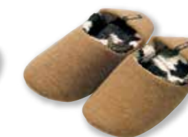
CA : M 157328 L 158202