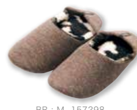
BR : M 157298 L 158172