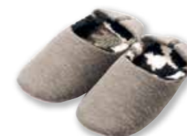
GY : M 157311 L 158196