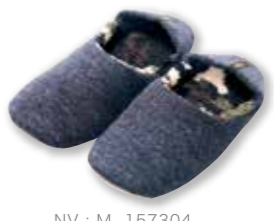
NV : M 157304